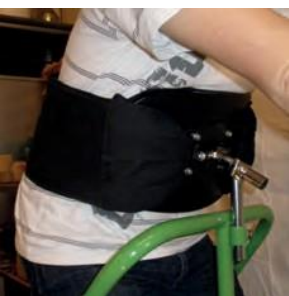
Bälte och bröstplatta

Exempel på tillbehör – se vår hemsida fysioaid.se för info om färger, delar och tillbehör som används för våra varumärken PETRA, CAVALIER, FF, CROSS RUNNER och X STRONG RaceRunner.