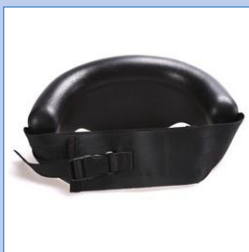
Bålstöd, halvcirkel med bälte & T-stolpe