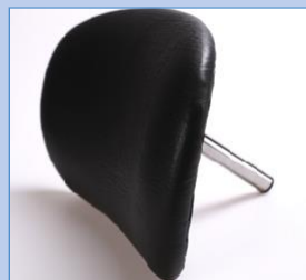
Vela bröstplatta standard

De flesta med liten styrka och stabilitet behöver en Nimbus banansadel och ett halvcirkel PUR-stöd med rem. Andra med mer styrka behöver en normal sadel och ett platt bröststöd.