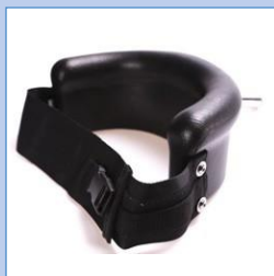
Bålstöd halvcirkel stl 1 med bälte & T-stolpe